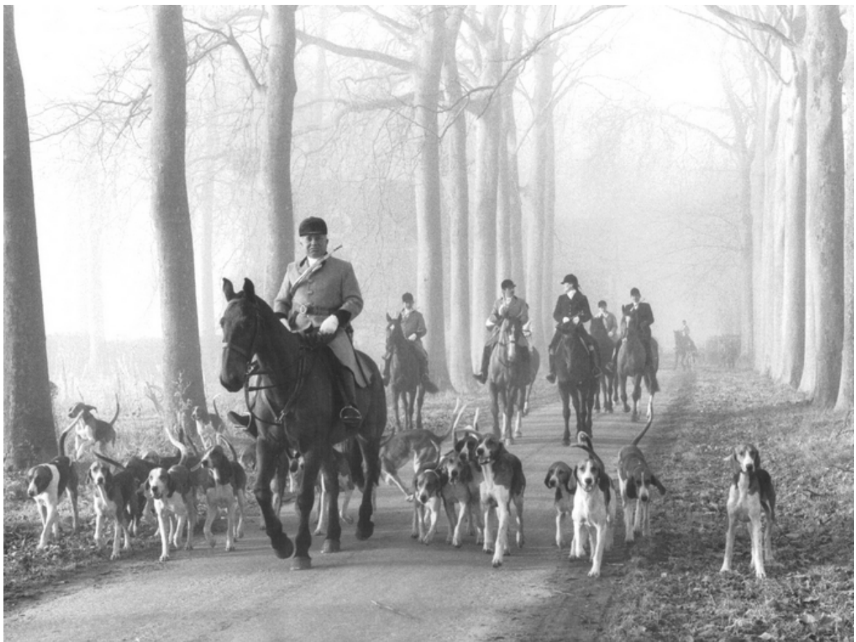
(Départ pour la chasse - Archives de l'Equipage Champchevrier - Don à la Société de Vénérerie)

A la mort du baron René en 1860, son fils Erasme, puis son petit-fils Léon en 1873, enfin son arrière-petit-fils Jean en 1911, se succédèrent à la tête de l'équipage.