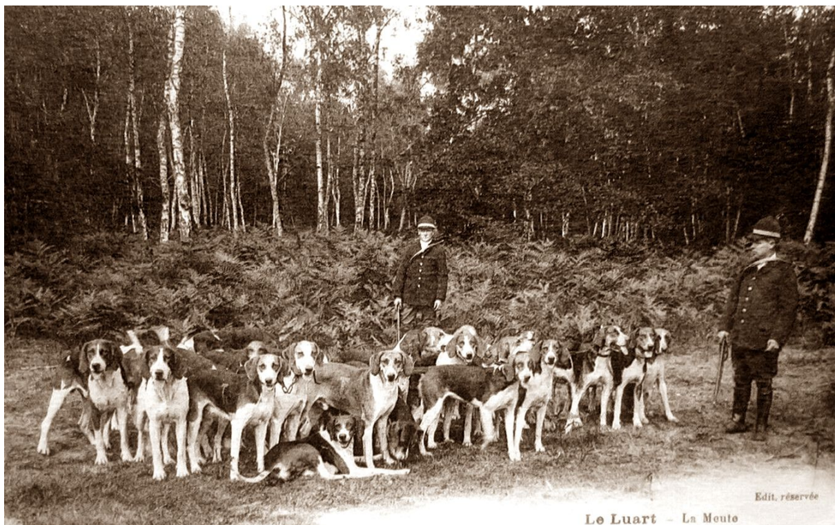
Le Luart - La Meute