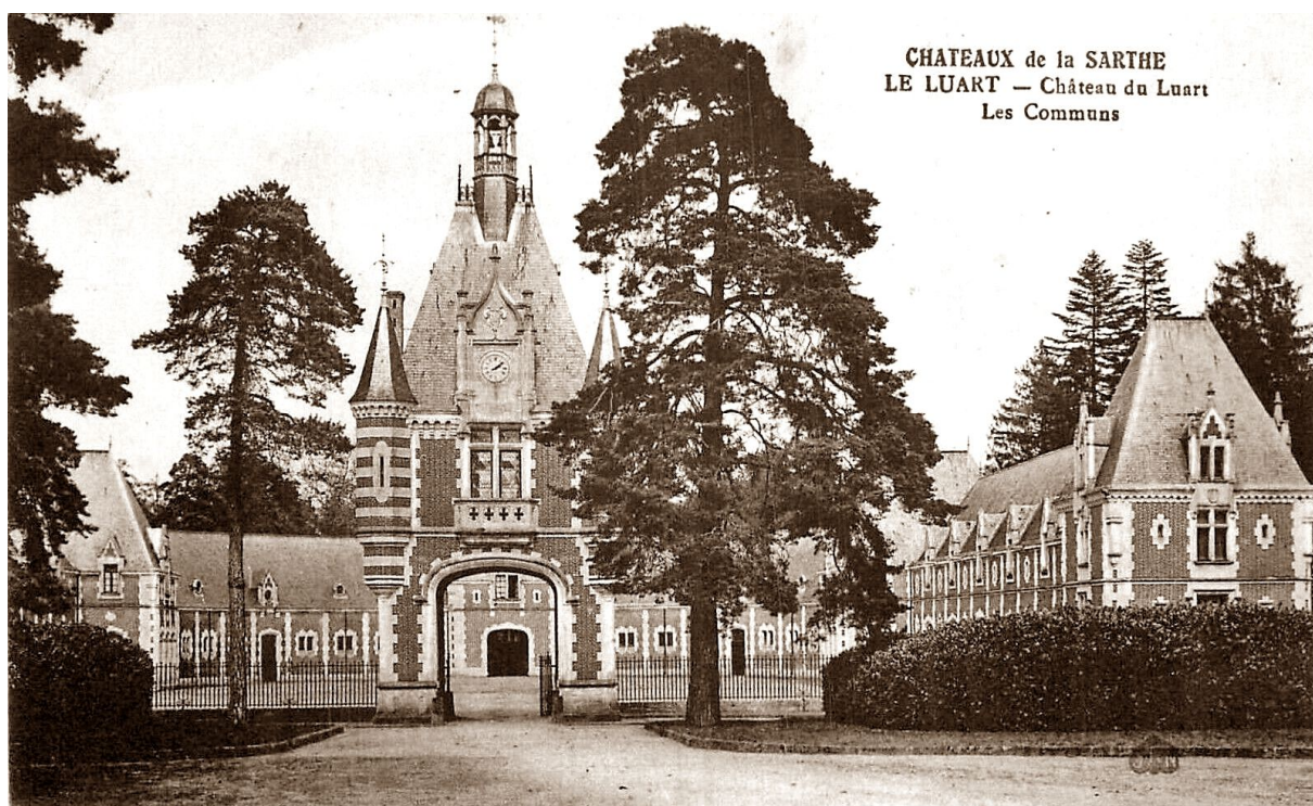
CHATEAUX de la SARTHE LE LUART - Château du Luart Les Communs