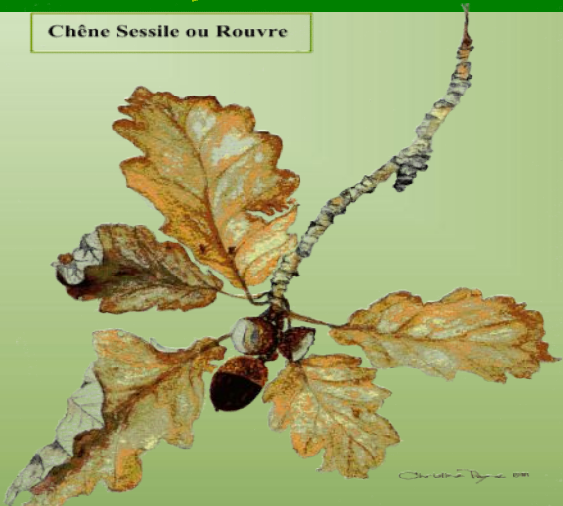
Chêne Sessile ou Rouvre

L'originalité des forêts Sarthoises provient de la génétique de ses chênes.