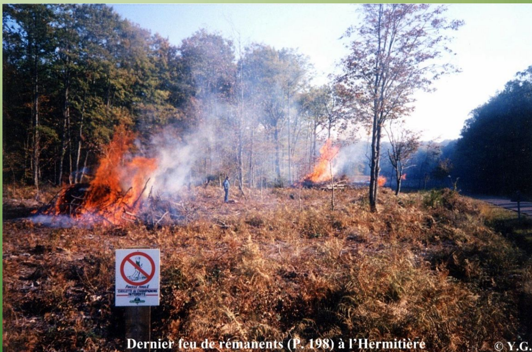
Dernier feu de rémanents (P. 198) à l'Hermitière

Des gestes simples à apprendre pour protéger notre environnement