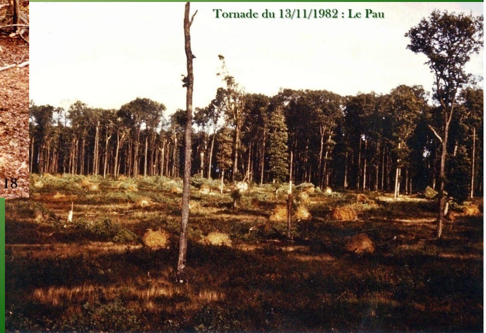
Tornade du 13/11/1982 : Le Pau

Le vent est avec le feu un fléau de la nature