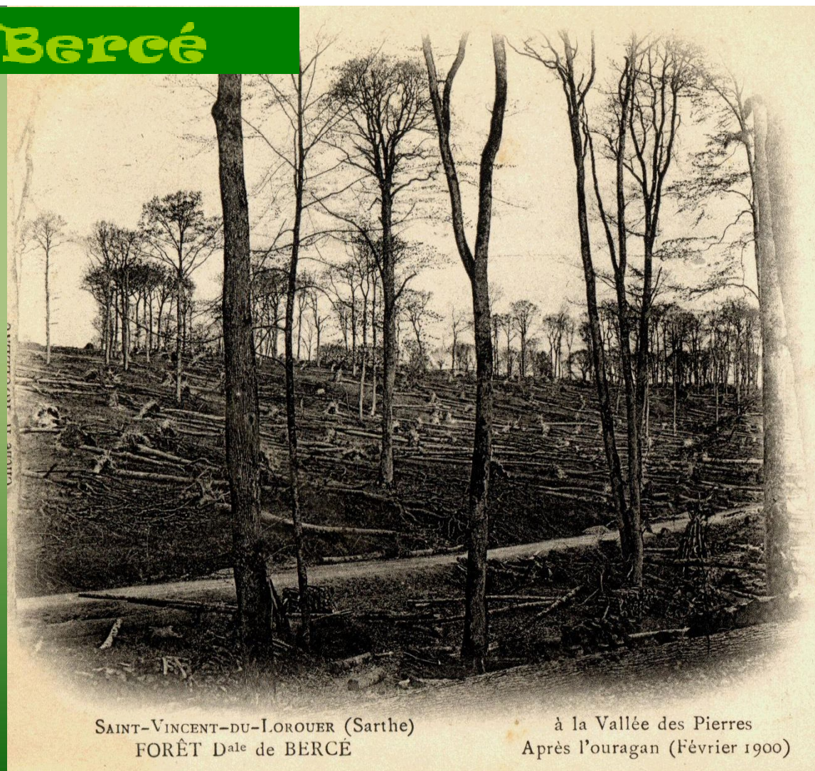
SAINT-VINCENT-DU-LOROUER (Sarthe) FORÊT D ale de BERCÉ

Le vent est avec le feu un fléau de la nature