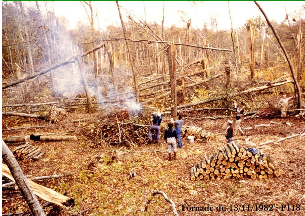
Tornade du 13/11/1982 : P118

Le vent est avec le feu un fléau de la nature