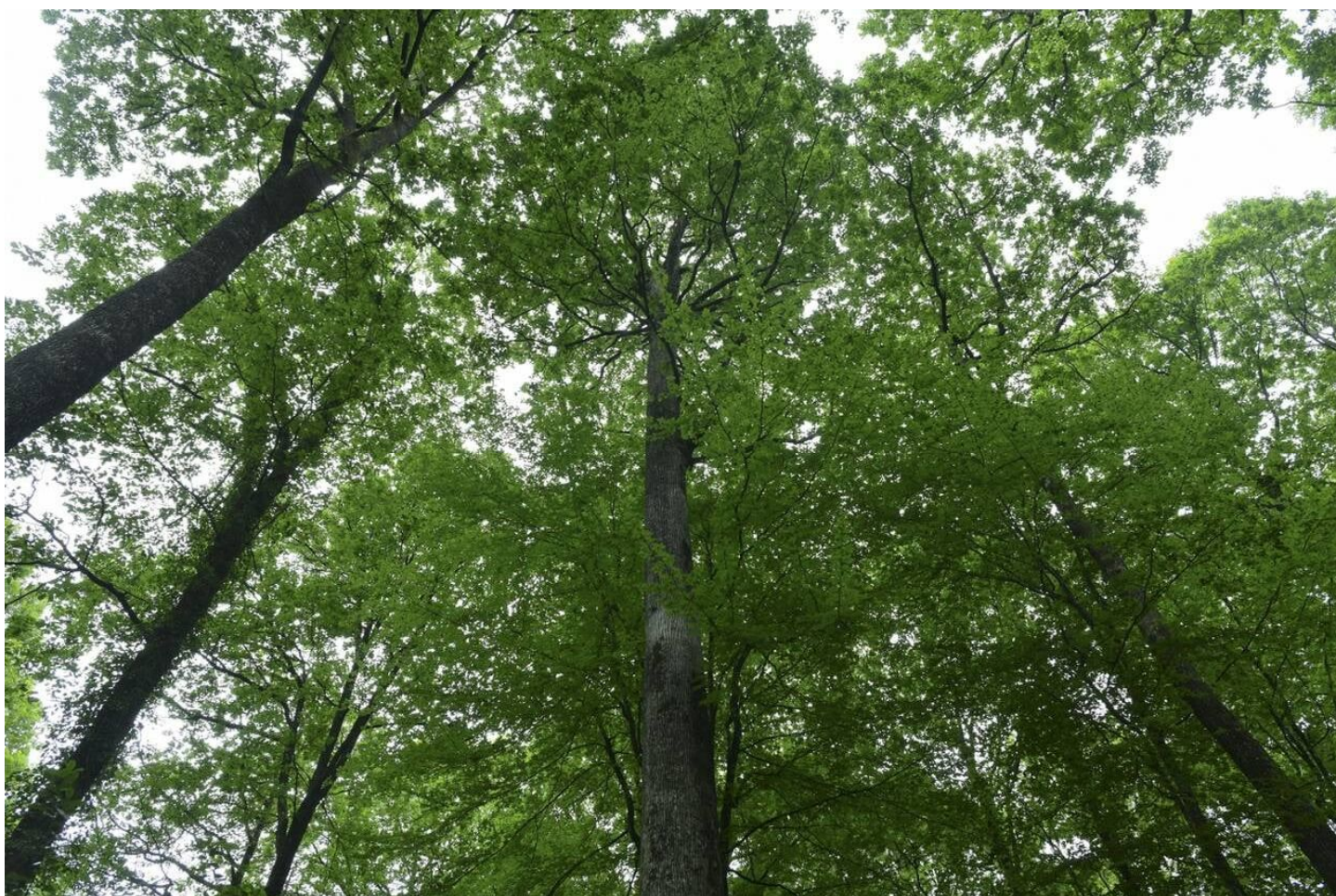
Le chêne Sermaise mesure plus de 40 m.

Pour les professionnels de la culture du bois, c'est un mystère de la nature. « On a essayé de faire le même coup quand j'étais en fonction. Jamais ça n'a marché. »