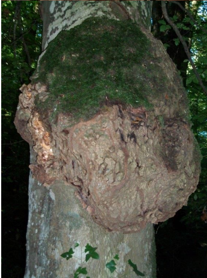
Chancre sur hêtre le 14 octobre 2014 et à droite parcelle 193 (octobre 2022)