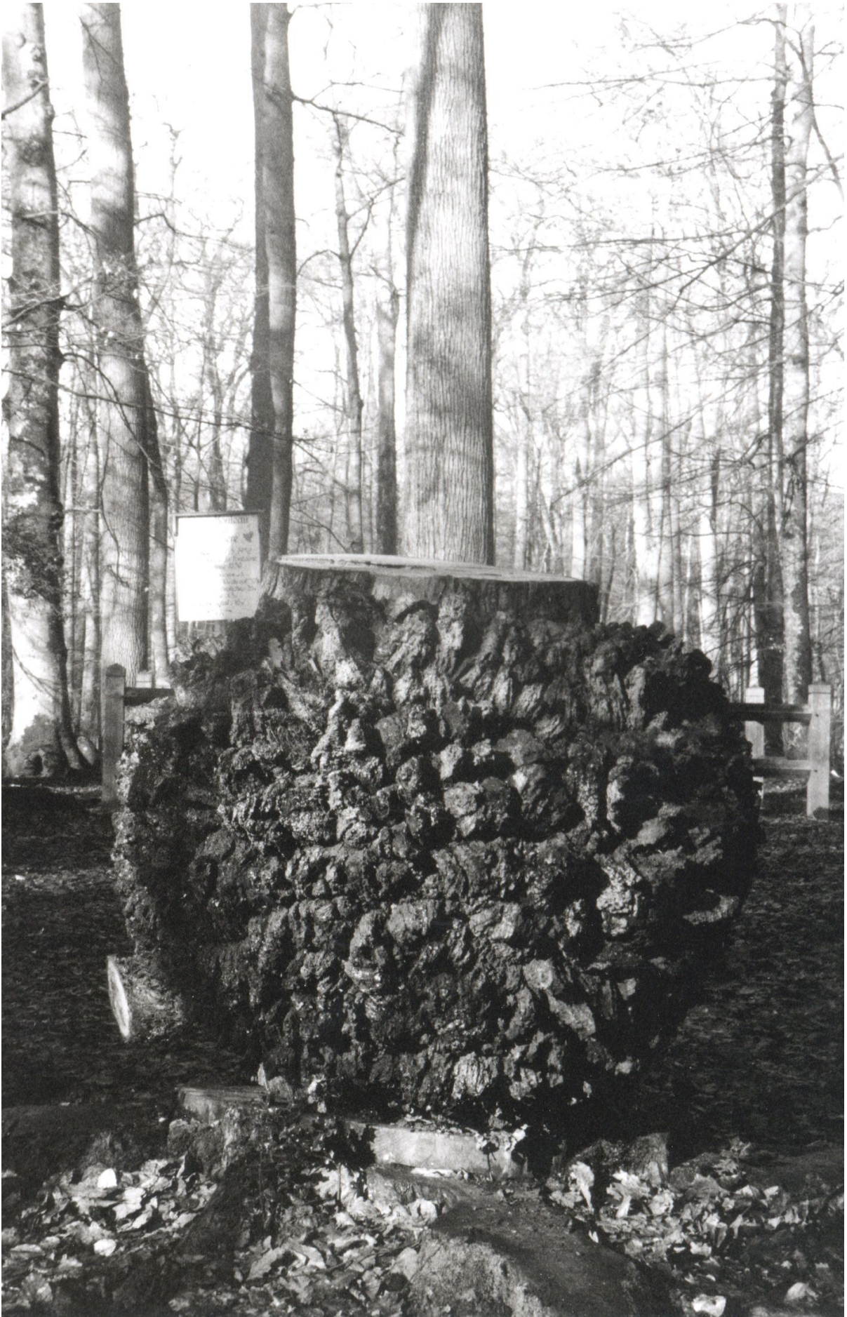
Chancres de la parcelle 226 en 1999 le 13 mai 1999