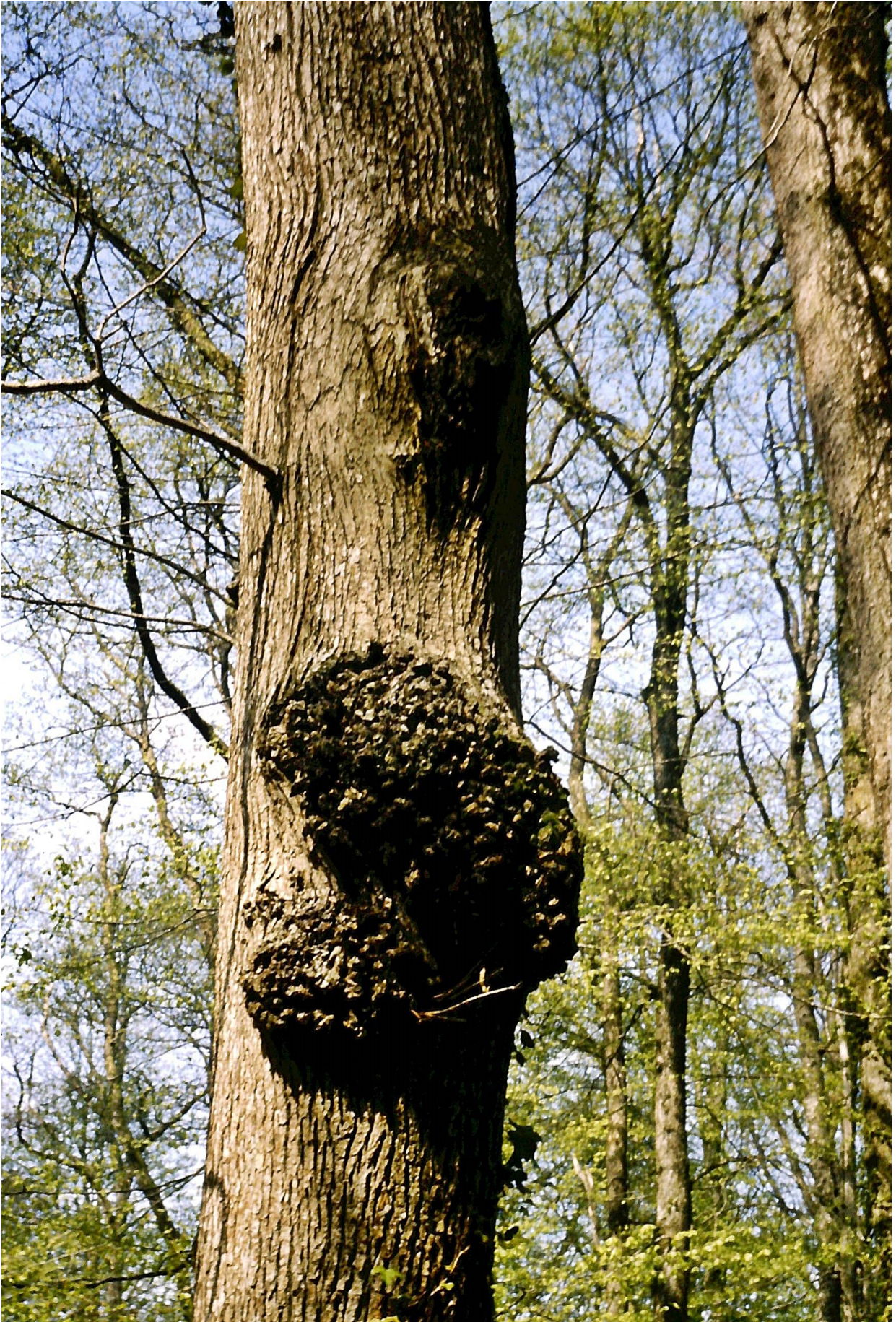
Chancres à phomopsis dans la parcelle 212 le 05 avril 1974