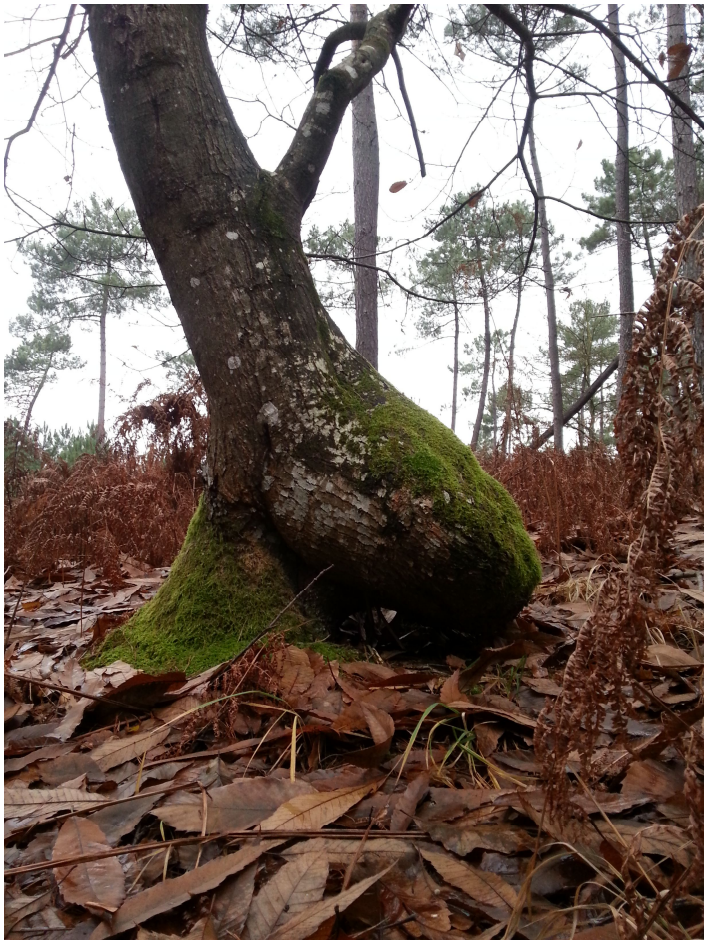
Graisse d'un châtaignier dans la parcelle 100 le 3 décembre 2014