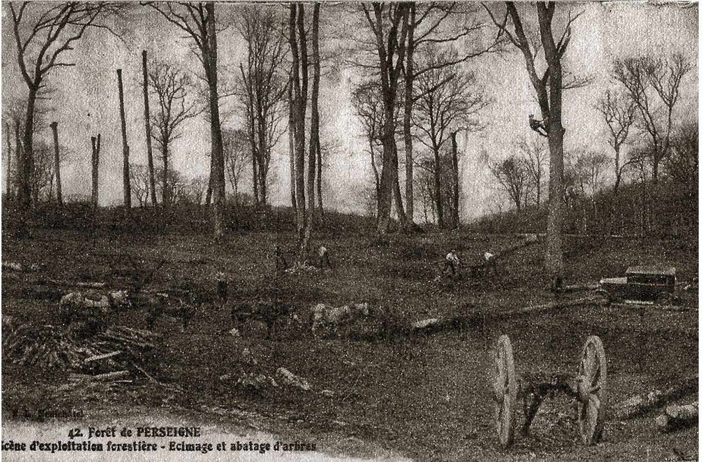
42. Forêt de PERSEIGNE Scène d'exploitation forestière - Eclairage et abatage d'arbres