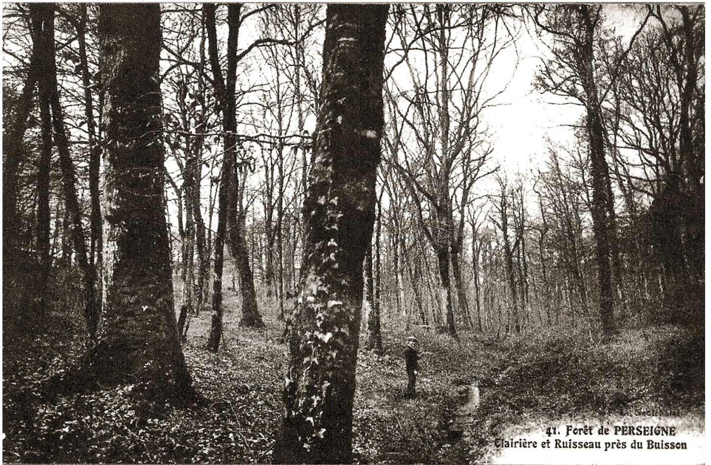
41. Forêt de PERSEIGNE Clairière et Ruisseau près du Buisson