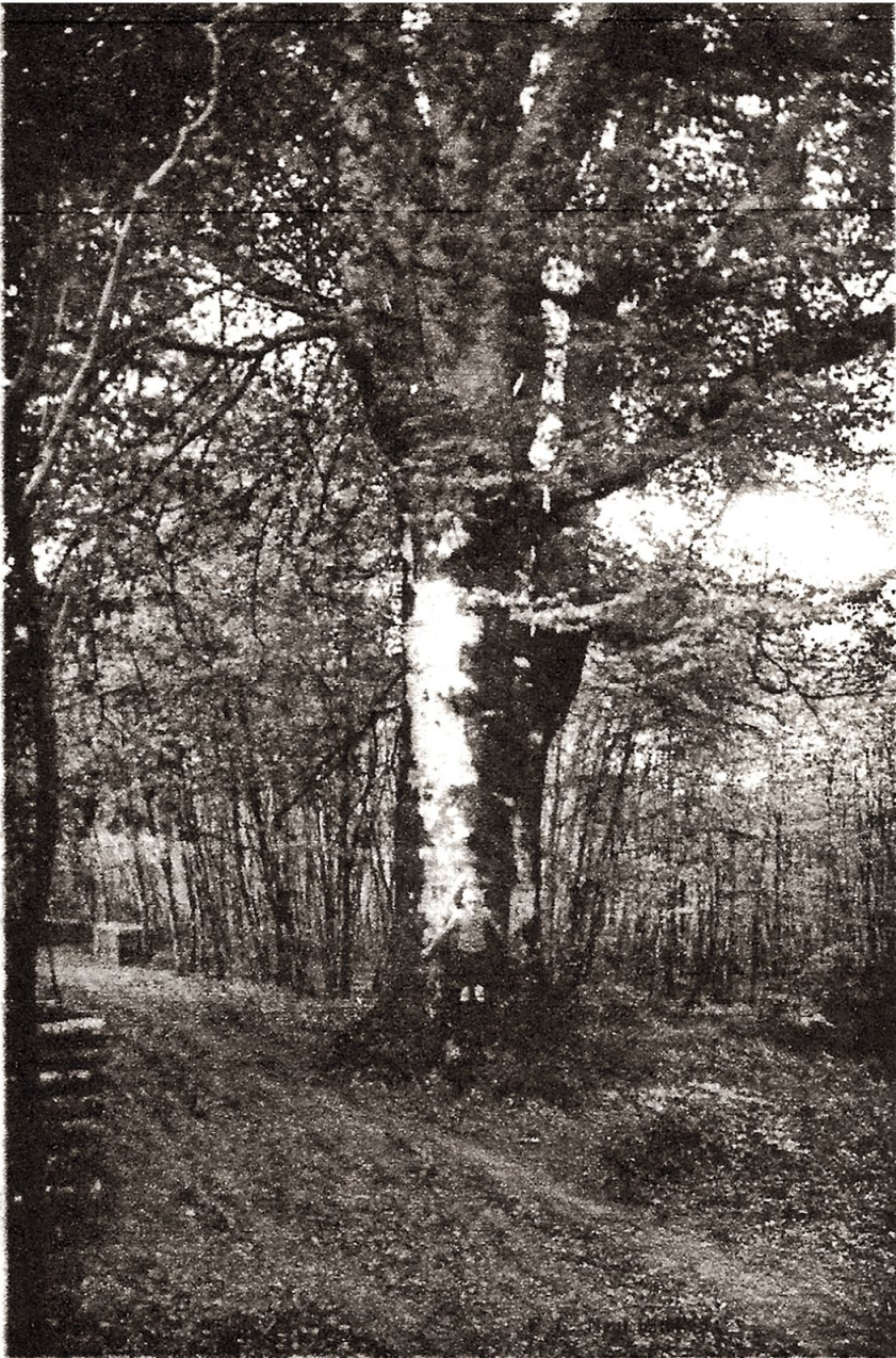
26. Forêt de PERSEIGNE — Le Hêtre Bertin, un géant et un ancêtre de la forêt (4 m. 30 de circonférence)