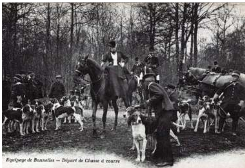
Équipage de Bonnelles — Départ de Chasse à courre