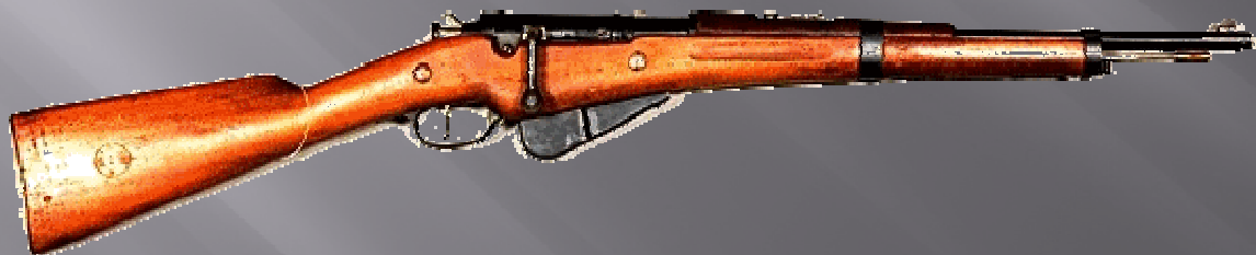
Carabine Berthier 1916