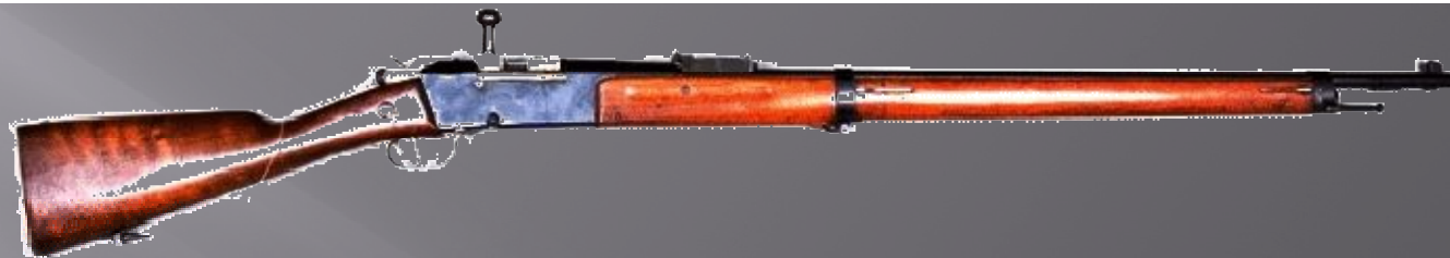
Fusil Lebel 1886