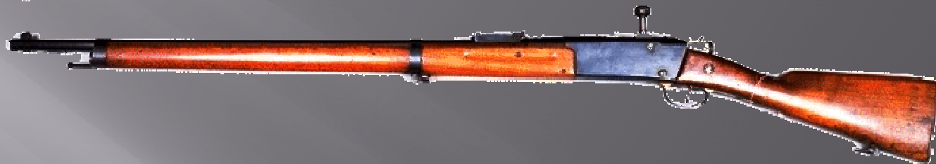
et sa baïonnette Rosalie