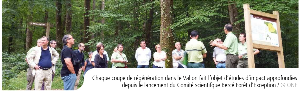
Chaque coupe de régénération dans le Vallon fait l'objet d'études d'impact approfondies depuis le lancement du Comité scientifique Bercé Forêt d'Exception

Le Vallon de l'Hermitière, ou la Source de l'Hermitière, constitue l'un des joyaux naturels, culturels et historiques qu'abrite et protège le massif de Bercé. Assurer son avenir en préparant la nouvelle génération d'arbres tout en préservant les richesses de ce milieu si particulier, c'est l'objectif que s'est donné le Comité scientifique créé sous Bercé Forêt d'Exception. En effet, associés depuis 2016, avec pour ambition d'assurer cette régénération tout en protégeant la biodiversité exceptionnelle dont le site permet l'expression, naturalistes locaux, techniciens forestiers territoriaux et experts naturalistes nationaux de l'ONF ont constitué un Comité Scientifique. Cette action, prévue par le label Bercé Forêt d'Exception, est inscrite dans le Livret « 14 actions pour la forêt et le territoire » !