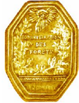
plaque de garde