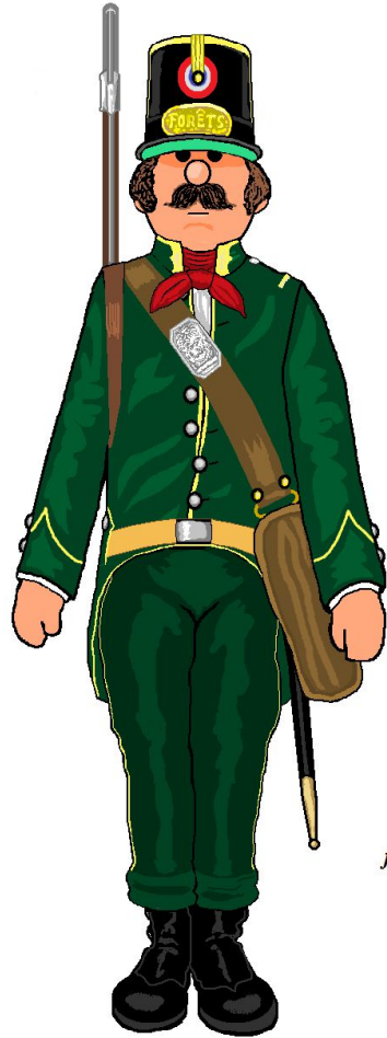
garde à pied