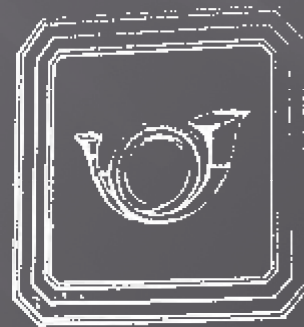
Plaque de schako des préposés