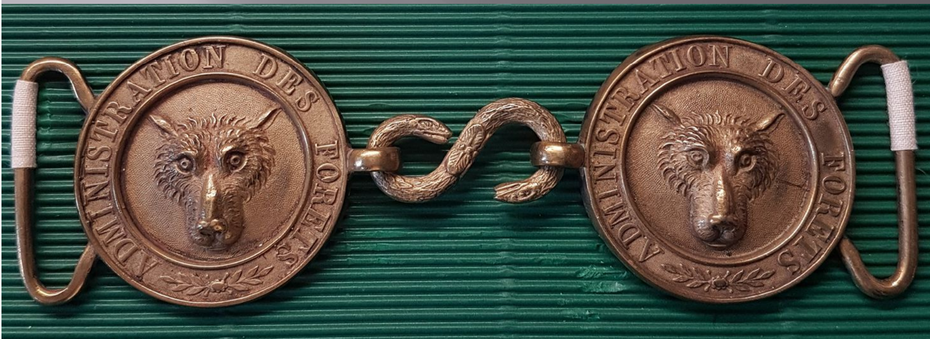
Boucles de ceinturon postérieures à 1820