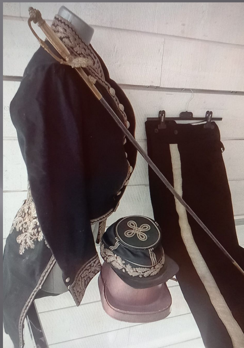
Habit de conservateur.