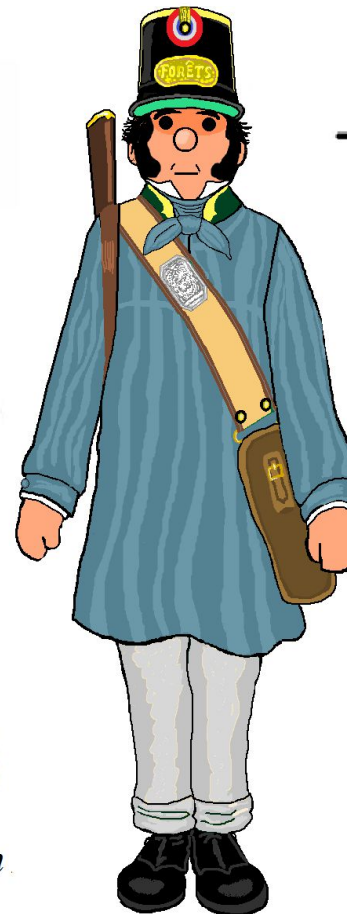
garde à pied tenue de travail