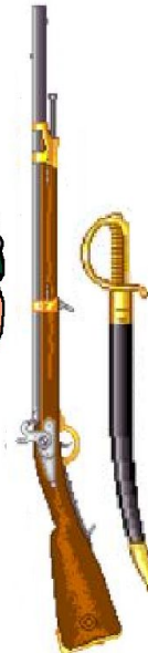
mousqueton mle 1842