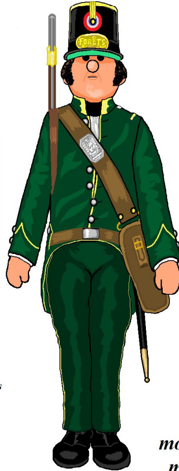
garde à pied