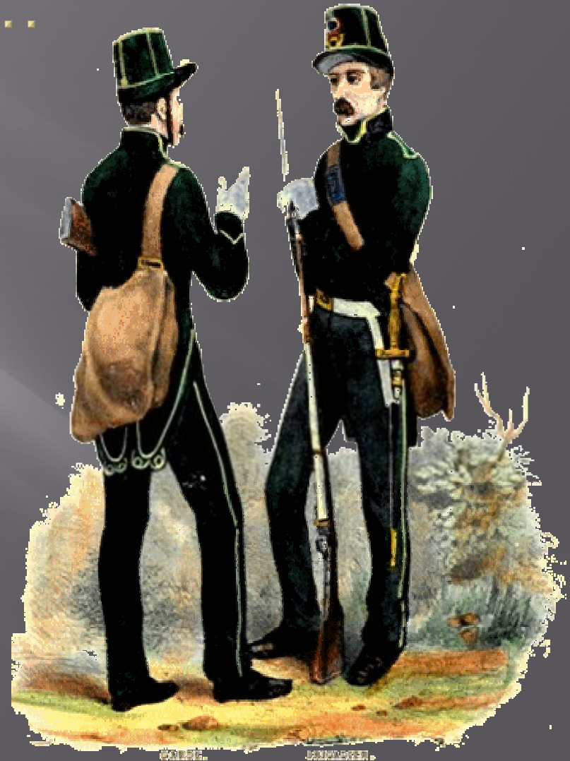
COSTUME DE BRIGADIERS ET GARDES FORESTIERS (Déterminé par l'Arrêté Ministériel du 8 Août 1840)

Sac de chasse, bandoulière, ceinture en buffle jaune.