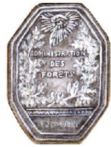
plaque de garde