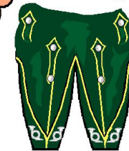
cors argentés pour le brigadier